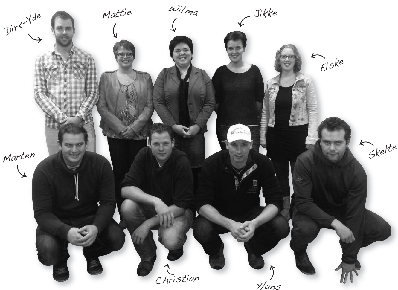
It haadbestjoer fan Keatsferiening Easterein

06-49942283 06-30151578 06-44057088 06-36105822